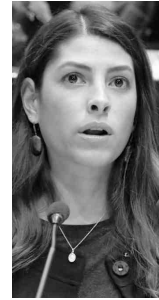
Sylvana Beltrones Sánchez Senadora

‘Ha quedado demostrado que con las medidas actuales se ha puesto en peligro a mujeres, niños y adolescentes... quienes cometen los ilícitos vuelven a la calle’.