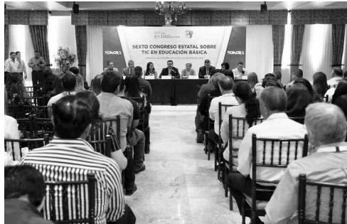
El encargado de despacho de la SEC reiteró el compromiso del Gobierno del Estado de desarrollar políticas educativas que estimulen el desarrollo intelectual de la comunidad escolar.