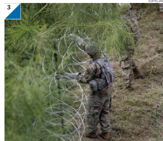
señaló el Pentágono en un comunicado divulgado.