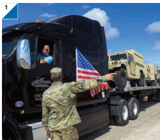
1 » El Departamento de Defensa de Estados Unidos informó que ya son más de 5 mil 600 los militares presentes en la frontera sur y reiteró que calcula desplegar a unos 7 mil soldados en la zona durante las próximas semanas para evitar la entrada de dos