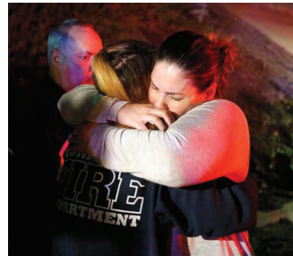
Bastante preocupación causó el incidente.