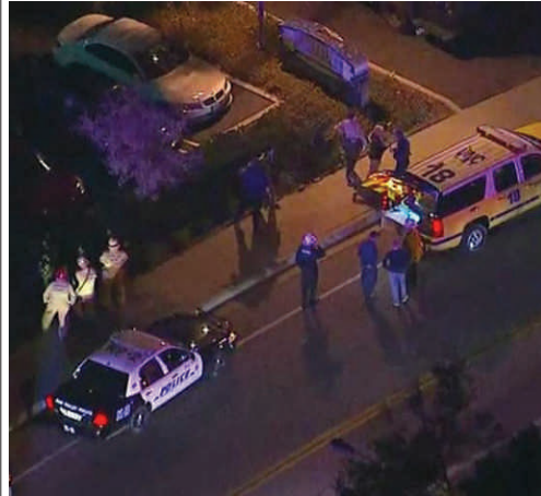
La policía acudió al lugar de la masacre.