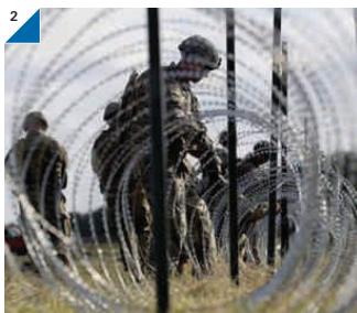
caravanas de inmigrantes procedentes de México.