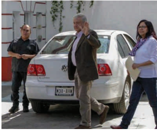
Andrés Manuel López Obrador dio a conocer algunos de los titulares de las instituciones económicas y hacendarias.