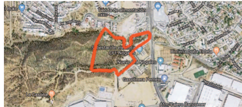
Terreno que la pasada administración cedió a la empresa como abono, ubicado a espaldas del panteón Jardines del Buen Pastor y la CFE, cuyo acuerdo fue revocado por el actual gobierno.

En el documento entregado a la contraloría señala: "...La información que usted ha verificado en los medios de comunicación sin sustento legal alguno, han afectado considerablemente tanto el prestigio de mi representada, como la credibilidad en las operaciones que realiza Galleta Distribuidora...".