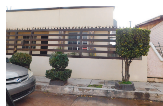
La empresa tiene esta vivienda en la calle Cipreses 709 como domicilio fiscal, pero asegura tener la bodega en Bulevar Pueblitos # 93, local 5.