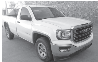
El pick up GMC resultó con reporte de robo en EU.

» El conductor logró internarse en el monte, luego de que le marcaran el alto para después huir a pie