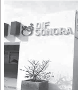
Ya van tres menores que se fugan del DIF.

La reportante mencionó que ignora por qué lugar salió, y hacia donde se dirigió es por ello, que reportó la fuga, para solicitar la presencia de las autoridades, y pedir los apoyos en la búsqueda del menor.