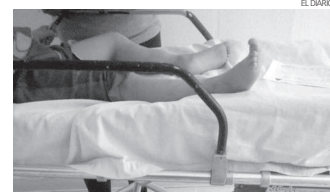
El niño sufrió fractura en peroné de pierna derecha.

» El menor de apenas 5 años salió corriendo hacia la calle