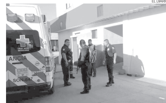
El afectado fue atendido en la Cruz Roja y luego fue llevado a un hospital.

» Fue atacado por varios hombres cuando caminaba dentro del fraccionamiento Puéblitos