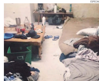
Las víctimas fueron obligadas a vivir en condiciones miserables en lugares en Barrie y Wasaga Beach.