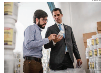
El autoproclamado presidente de Venezuela, Juan Guaidó, entregó la ayuda humanitaria de la Asociación de Centros de Salud.

Guaidó, que se proclamó como presidente interino y fue reconocido como tal por más de 40 países de Europa y América, lidera una operación para hacer llegar a Venezuela ayuda humanitaria enviada por una