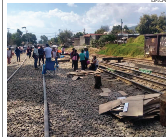
El sector indígena comentó que el viernes 15 de febrero volverán a reunirse en una asamblea masiva para analizar los avances.