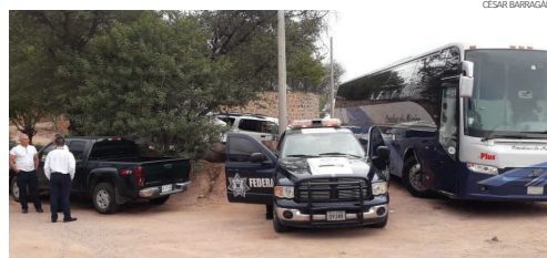
Autoridades llevaron el camión de pasajeros hasta el C-4, donde al revisarlo hallaron sustancias ilegales.

Fue minutos después de las 13:00 horas que agentes de la PFP arribaron a las instalaciones del C4 escoltando un autobús Volvo 9700, con logotipo de la empresa "Omniabus de México", con número económico 3214, procedente del sur