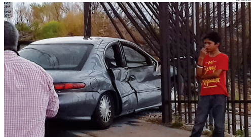
Cuantiosos daños materiales sufrió el vehículo que tripulaba la mujer afectada.

Metros a un lado se encontraba un sedán Mercury LeSabre color gris oscuro, el cual chocó y derribó de su base parte de un barandal metálico propiedad de dicha