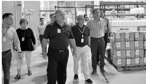
Para conocer la logística y movilidad en la industria maquiladora visitaron naves industriales en Guaymas y Empalme.

Indicó que las autoridades de Arizona colaborarán en el