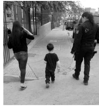
La hermana del niño los guió hasta su domicilio donde estaba su abuela, a quien le fue entregado el menor.