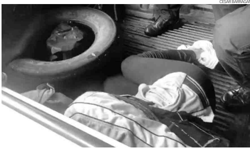
Policias municipales tuvieron que retener por unos momentos a la joven mujer.