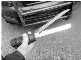
Los cuchillos que traía la mujer.

Fue alrededor de las 14:00 horas que autoridades y cuerpos de rescate fueron alerta-