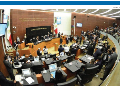
El Congreso de la Unión llamó formalmente al gobierno de la República a implementar acciones mediante slogans.