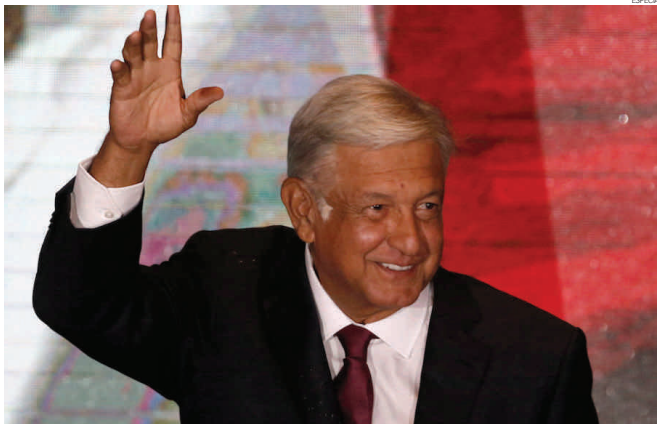
Andrés Manuel López Obrador aseguró que la austeridad republicana va en serio y todo lo que ofreció en campaña lo va a cumplir.

En la administración federal, Andrés Manuel López Obrador dijo que se van a reducir delegaciones, subsecretarías, direcciones generales y todos los puestos que se duplican, respetando a los trabajadores de base o sindicalizados.