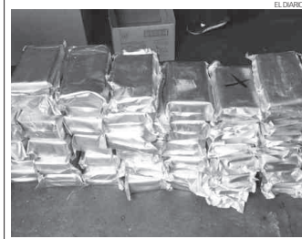
Las drogas aseguradas en ambos incidentes están valuadas en más de 700 mil dólares en el "mercado negro" de EU.

Por lo que el señalado quedó a disposición de un Ministerio Público del Fuero Común, para el deslinde de responsabilidades.