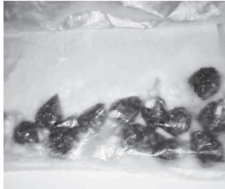
Porciones de droga que le decomisaron.

Por lo que se inició una persecución, siendo éste alcanzado por los uniformados, señalándole que había corrido por que traía bronca, al ser inspec-