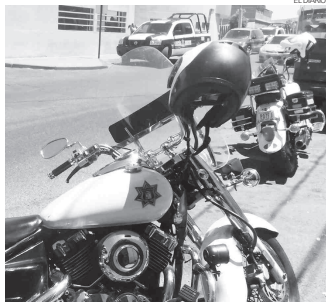
Agentes de Tránsito Municipal se hicieron cargo del percañe.

dicho vehículo fue remolcado al corralón municipal para su futura entrega.