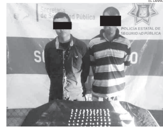
A disposición de las autoridades federales quedaron las dos personas.

Dentro del vehículo encontraron alrededor de 100 envoltorios que contenían sustancia granulada, con características físicas a la metanfetamina, por lo que de inmediato fueron asegura-