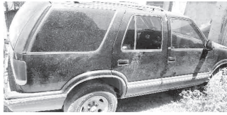
Auto que tenía reporte de robo.

Por lo que los agentes verificaron la serie en la base de datos de Plataforma México, siendo alertados de reporte de robo del día 07 del mes y año en curso, los cuales señalan que fue robada en el cruce de Carretera y Colinas del Yaqui.