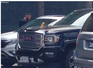
Vehículo del afectado.