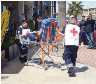
El joven baleado fue trasladado por socorristas a un hospital de esta frontera.