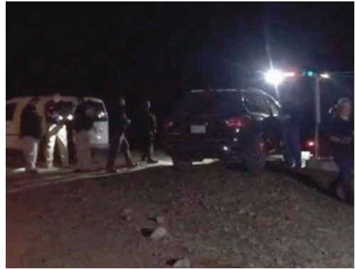
Residentes de la zona dieron aviso a las autoridades sobre el hallazgo.

Elementos de la AMIC realizaron las investigaciones correspondientes en coordinación con personal de la Fis-