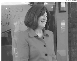
Susan M. Elbow, Ministra Consejera para Diplomacia Pública de la Embajada de los Estados Unidos en México.

"Ellos no son legales en Estados Unidos, debemos tener todos esos puntos de vista en cuenta para encontrar a una solución".