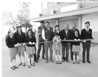
Cuauhtémoc Galindo, junto a Marco Antonio Mares y Omar Montiel, inauguraron la pavimentación en el plantel.

"Seguimos comprometidos con la educación y durante esta administración", destacó, "hemos entregado más de 250 obras de infraestructura entre pavimentaciones, escalinatas, rampas, electrificaciones, espacios públicos, tejabanos, obras especiales en baños, todo lo que necesita la