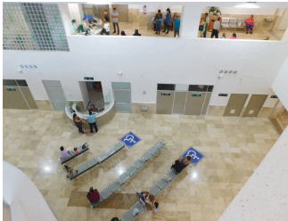
El nuevo Hospital General de Zona número 5 del IMSS opera con más del 85 por ciento del personal.