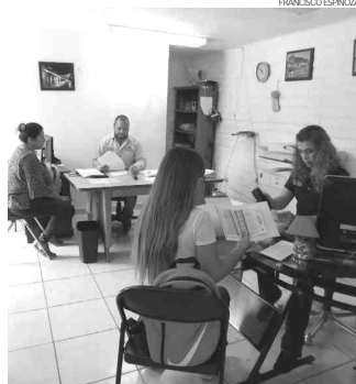
Un total de mil 800 estudiantes de primaria, secundaria y preparatoria se benefician con el programa de becas del Gobierno de la Ciudad.

La recepción de documentos de los aspirantes a una beca para el ciclo escolar 2018-19, registra un importante avance con la atención en promedio, de 300 jóvenes y padres de fa-