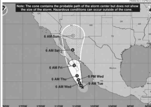
Autoridades de protección civil estiman que la tormenta tropical "Bud" generará fuertes lluvias en distintos municipios del estado.

milia diariamente. "El proceso está muy avanzado en la captación de los documentos", indicó, "luego del registro de más de cinco mil aspirantes a las becas municipales, atendiendo a 300