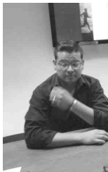
En conferencia de prensa el alcalde Cuauhtémoc Galindo anunció la carrera pedestre de cinco kilómetros a realizarse este sábado.

El registro no tiene costo alguno y se lleva a cabo en coordinación con la Liga Municipal de Atletismo, señaló, quienes tienen programadas varias actividades para niños y jóvenes en la pista del estadio de fútbol.