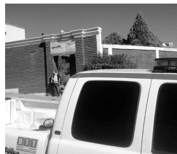
Tras los hechos la UEPC revisó la guardería.

dicos del lugar el pequeño recobró el conocimiento y fue diagnosticado fuera de peligro, quedando internado para la realización de exámenes clínicos.