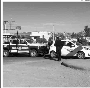
Policias municipales implementaron un operativo en busca del taxista acusado del presunto robo.

didó a sus familiares quienes ya están realizando los trámites para la entrega y el traslado del cuerpo.