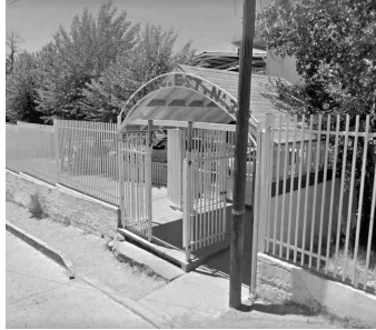
La afectada señala a tres menores como quienes le arrojaron el cuete cuando se encontraba en su salón.

Sobre el caso fue informado un Ministerio Público quien