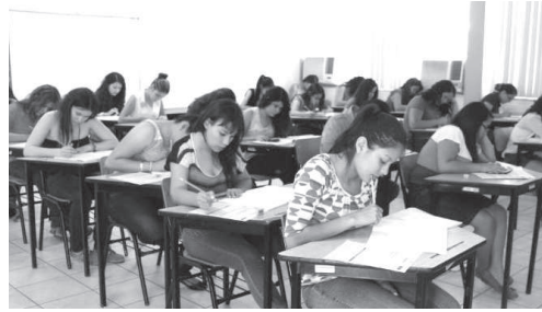
Llama SEC a cumplir con registro antes de la medianoche del domingo 17.

El funcionario estatal recomendó a padres de familia y tutores a revisar la convocatoria disponible en el sitio web, en compañía de los estudiantes, y supervisarlos durante el