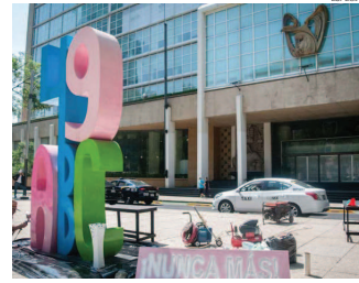
Comparece titular del IMSS ante el Senado.

"Yo no voy a poner en riesgo a ningún niño que entra a