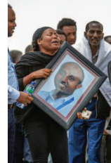
El accidente dejó 157 víctimas.

Un portavoz de la aerolínea ha dicho que al piloto se le dio permiso para regresar, pero el avión se estrelló minutos más tarde en las afueras de