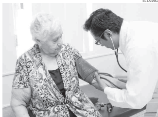
La instrucción de la gobernadora Claudia Pavlovich Arellano es mantener la atención de calidad.