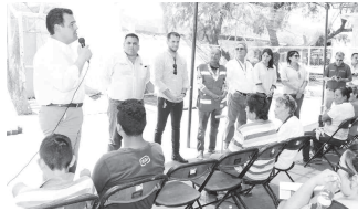
Díaz Brown especificó que en la donación del material destinado para las viviendas participan varias empresas.

“Es muy importante para nosotros como Gobierno del Estado tener estos acercamientos con la comunidad, es la instrucción que tenemos y es cómo vamos a ir resolviendo sus necesidades y carencias”, declaró el funcionario estatal.