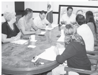
El Cabildo aprobó no aumentar los costos de la Tabla catastral para el 2018.

“Nuestros derechohabientes deben estar tranquilos en estas vacaciones, Isssteson está trabajando, todo el personal está laborando”, puntualizó Clausen Iberri.