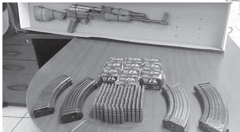
Las armas y cartuchos asegurados, al igual que el detenido quedaron a disposición de la PGR.