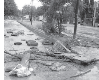
En diferentes sectores de la ciudad se reportaron caídas de árboles y daños en bardas.