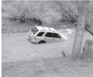
Una vagoneta fue arrastrada por la fuerte corriente de agua del arroyo del callejón Mariano Jiménez en la colonia lomas de Nogales.