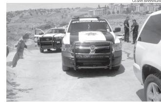
Agentes policiacos siguieron al joven por varias calles de la ciudad, hasta que lograron capturarlo.

Mientras que la lesionada de 24 años de edad fue internada