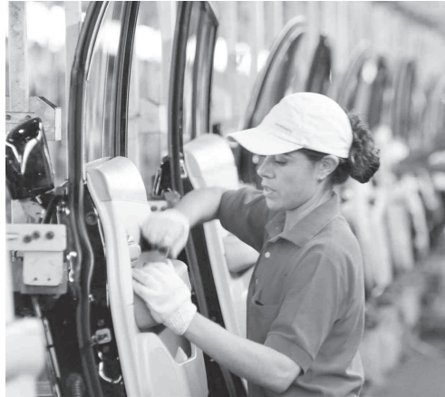
El IMSS dio a conocer que al 30 de junio pasado los trabajadores permanentes y eventuales urbanos afiliados alcanzaron la cifra récord de 19 millones 134 mil 58.

Esto significó la creación de 86 mil 233 puestos formales durante el sexto mes del año, la mayor generación de empleos para un