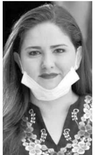
Alcaldesa Célida López Cárdenas.

También se acordó la construcción de una propuesta con medidas para la prevención y mitigación de contagios específicas aplicables a los distintos sectores de la comunidad que se ha venido construyendo por semanas de investigación, análisis y deliberaciones propuestas en el marco de la Alianza por un Heramosillo en Verde que encabeza Heramosillo cómo vamos?, buscando