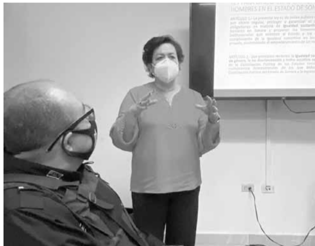
La titular del ISM presentó el trabajo que se realiza en la institución a favor de las mujeres.

“La primera solicitud de AVGM se hizo para Cajeme, en 2015, antes de que inicia-