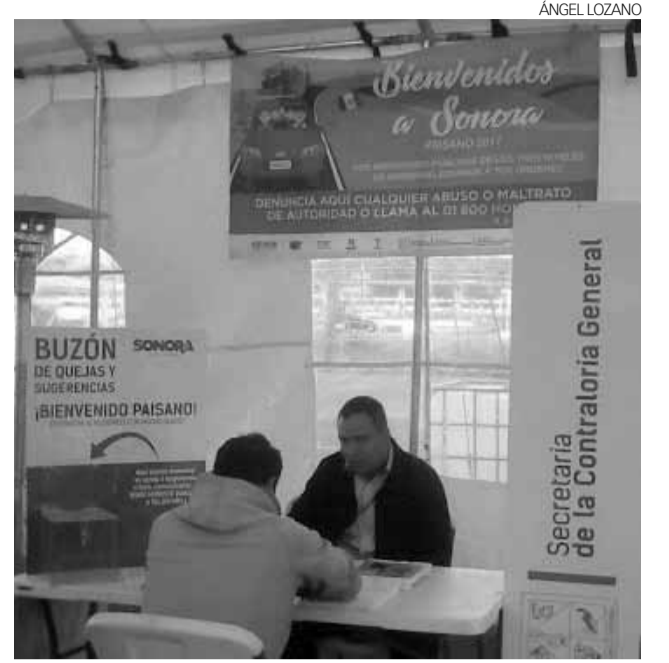
El Comité Estatal Anticorrupción, solicitará a la Contraloría del Estado que se responda de manera inmediata.

cráramos todas las dependencias posibles para trabajar de manera transversal y en unidad, para garantizar la seguridad de las mujeres, niñas y adolescentes sonorenses desde todos los frentes”, recalzó.