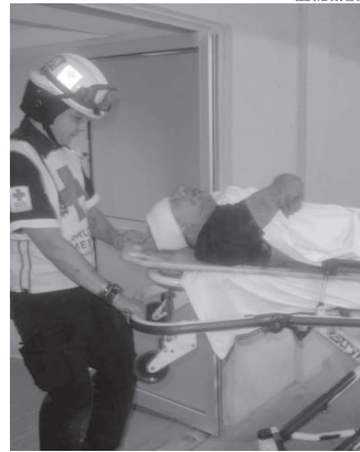
Tras resultar herido el joven fue llevado a un hospital, donde murió horas después.

La mujer indicó que en ese momento tomó el arma y la arrojó a la cocina y pidió una