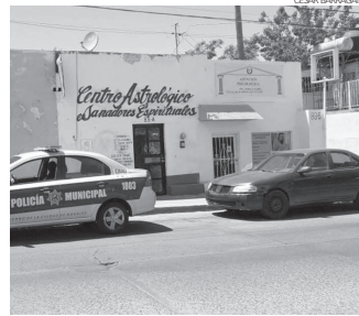
Los delincuentes para entrar al negocio dañaron una puerta trasera.