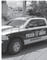
Policías municipales lo detectaron.

Ante la situación le pidieron al conductor que bajara del auto, para posterior realizar una inspección corporal, encontrándose entre sus pertenencias, una bolsa de plástico que contenía una sustancia granulada de color blanco, con las características propias de la droga conocida como "cristal".