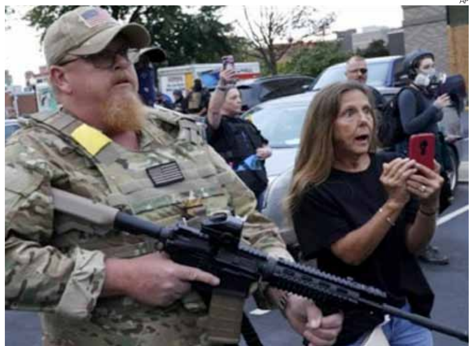
Integrantes del movimiento Black Lives Matter se manifestaron de nuevo en Louisville (imagen) contra la violencia oficial racista.