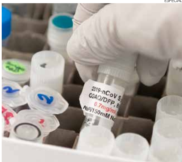
El gobierno de México ya declaró su adhesión al mecanismo Covax.