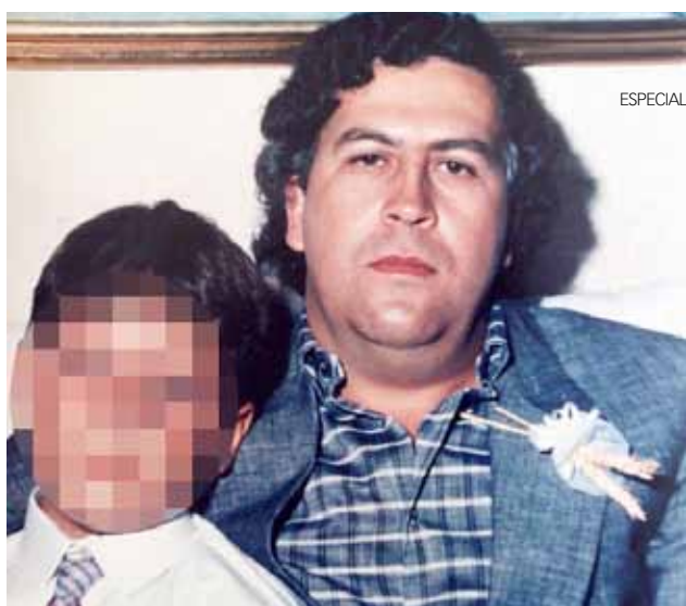
Existe una leyenda sobre el capo colombiano donde se aseguraba que tenía escondidas varias 'caletas' llenas de miles de billetes estadounidenses.