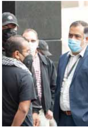
El fiscal especial del caso Iguala dialoga con padres de los 43 normalistas.