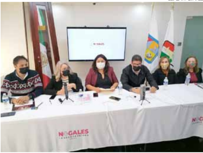
Las autoridades municipales informaron de las actividades a llevar a cabo durante el programa Mágica Navidad.

PREMIER "La casa de papel" cierra con acción