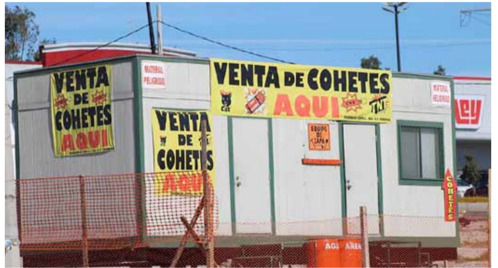
Las anuencias para la comercialización de productos con pólvora fueron canceladas por las autoridades municipales.

"Además que no es una economía que se quede en la ciudad, que genera una economía, vamos a prohibir para que se aclaren dudas, no es que nomás vamos a prohibir a los que no