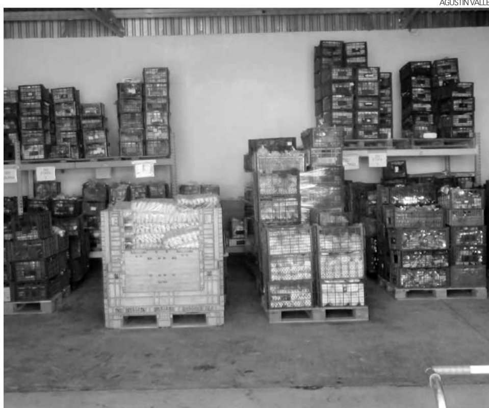
El Banco de Alimentos de Nogales ha incrementado su padrón de beneficiarios con nuevas familias nogalense.

De la misma forma se va a ha retomado la entrega de apoyos alimentarios cada mes, ya que con motivo de la pandemia y evitar aglomera-