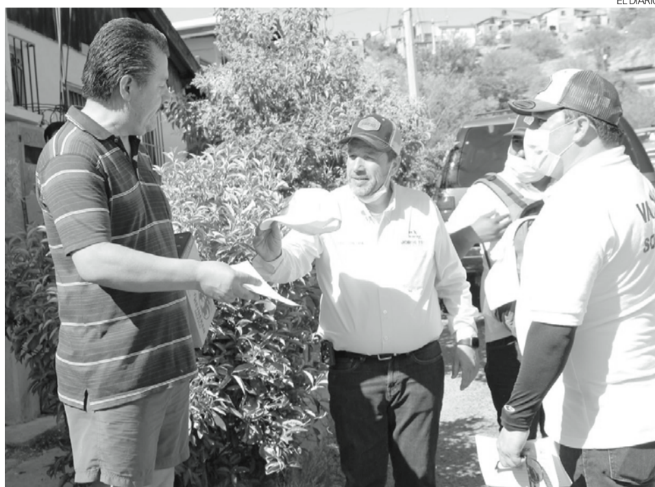
El candidato a la alcaldía por la alianza Va por Sonora visitó a los vecinos de la San Carlos y la San Miguel.

En la plática con los vecinos de San Miguel, donde también recorrió el tianguis, Freig Carrillo escuchó las ne-