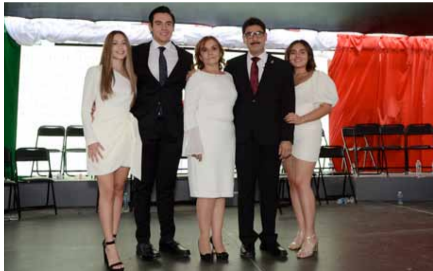
El munícipe junto a su familia.

ministrativa avanza y nosotros estamos listos para hacer de Nogales la gran frontera de México”, expresó al cierre de su discurso.