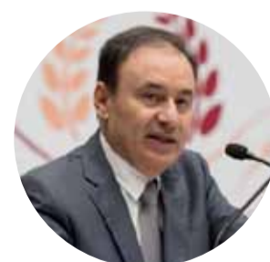
Alfonso Durazo Gobernador de Sonora

"De tal manera que voy a llegar en algún momento a contar con los recursos suficientes para pagar la inscripción de todos los estudiantes de educación pública de nivel superior en el estado de Sonora".