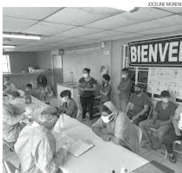
El albergue San Juan Bosco espera las donaciones de los ciudadanos para apoyar a los migrantes.

ción se brinda de 08:30 a 16:00 horas en las instalaciones del Consulado de México en Estados Unidos ubicado en 135 West Cardwell Street en Nogales, Arizona.